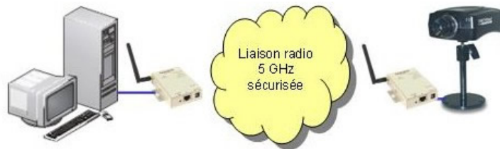
REPLACEMENT D'UN CABLE DE CONNEXION AU RESEAU ENTREPRISE