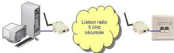
INTERCONNEXION DE DEUX RESEAUX ETHERNET