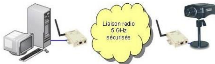
REPLACEMENT D'UN CABLE DE CONNEXION AU RESEAU ENTREPRISE