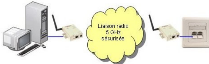
INTERCONNEXION DE DEUX RESEAUX ETHERNET